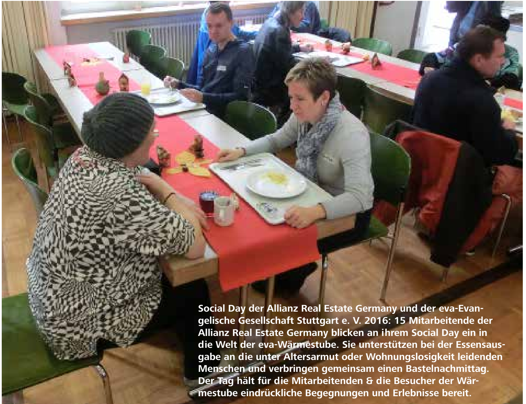
Social Day der Allianz Real Estate Germany und der eva-Evangelische Gesellschaft Stuttgart e. V. 2016: 15 Mitarbeitende der Allianz Real Estate Germany blicken an ihrem Social Day ein in die Welt der eva-Wärmestube. Sie unterstützen bei der Essensausgabe an die unter Altersarmut oder Wohnungslosigkeit leidenden Menschen und verbringen gemeinsam einen Bastelnachmittag. Der Tag hält für die Mitarbeitenden & die Besucher der Wärmestube eindruckliche Begegnungen und Erlebnisse bereit.