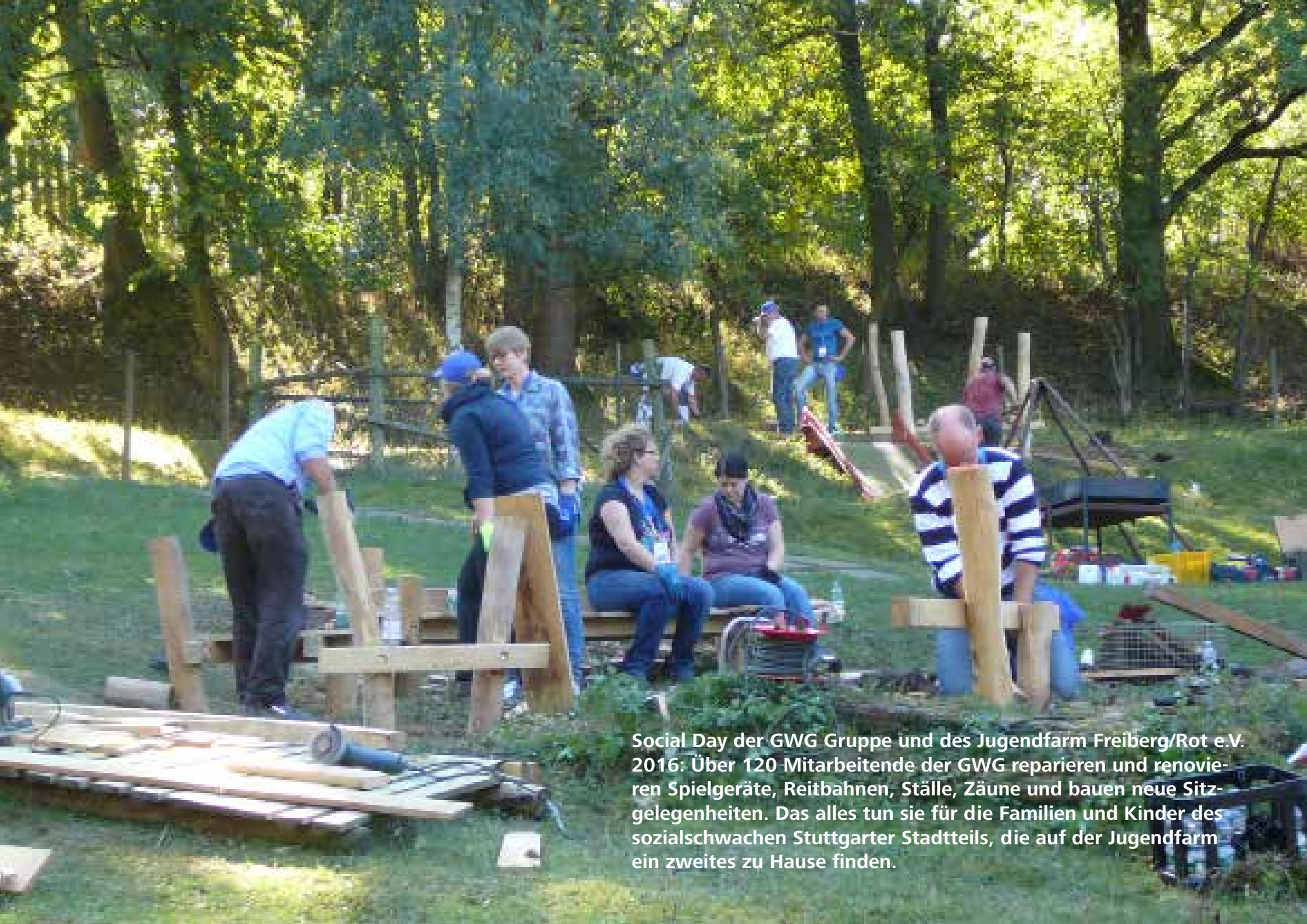
Social Day der GWG Gruppe und des Jugendfarm Freiberg/Rot e.V. 2016: Über 120 Mitarbeitende der GWG reparieren und renovieren Spielgeräte, Reitbahnen, Ställe, Zäune und bauen neue Sitzgelegenheiten. Das alles tun sie für die Familien und Kinder des sozialschwachen Stuttgarter Stadtteils, die auf der Jugendfarm ein zweites zu Hause finden.